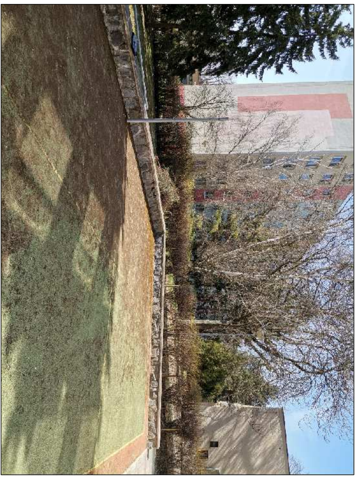
FOTO 1 - SOUČASNÝ STAV HRŠTĚ S KAMENNOU ZÍDKOU